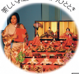
楽しい雛様と出会うひととき

大人 /// 前売券 1500円 (当日券 2000円) 高校生以下 /// 前売券 800円 (当日券 1000円) 妊婦さん /// 無料 (要 整理券)