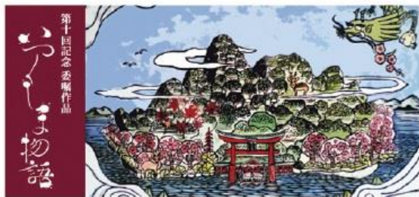
第10回記念委嘱作品

今、日本が世界へ伝えたい「いつくしみ」の心をテーマに 21枚の版画と語り、和楽器、洋楽器に合唱のハーモニーが織りなす 私たちのふるさと「宮島」の物語をお届けします。