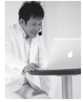
映像・版画・墨彩画 舌 ガタロウ

広島県出身。 東京芸術大学音楽学部邦楽科卒業。同大学大学院音楽研究科修了。在学中、宮中桃華学堂に於て御前演奏。同大学非常勤講師。日本音楽集団団員。古典から現代曲まで幅広く活動する傍ら、小中高等学校などでのワークショップにて、邦楽器や伝統音楽の魅力を伝える事にも力を入れている。